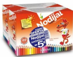
Nodijal Jalea Real infantil