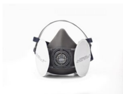
Máscaras de seguridad