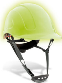
Cascos de seguridad