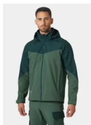
Chaqueta softshell Hooded