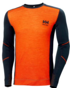
Camiseta de lifa merino Crewneck