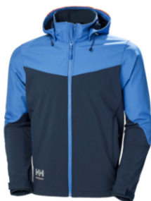
Chaqueta softshell Oxford Hooded