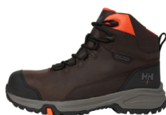
Botas de seguridad MANCHESTER